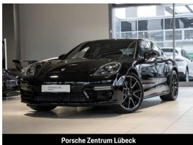
Porsche Zentrum Lübeck