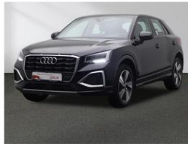
SENGER Audi Zentrum Münster Senger AZ Münster GmbH