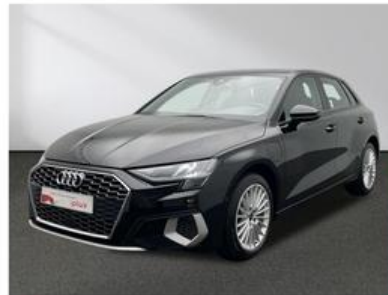
SENGER Audi Zentrum Münster Senger AZ Münster GmbH