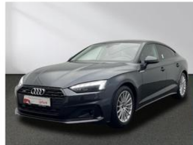
SENGER Audi Zentrum Münster Senger AZ Münster GmbH