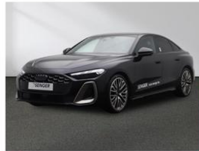
SENGER Audi Zentrum Münster Senger AZ Münster GmbH