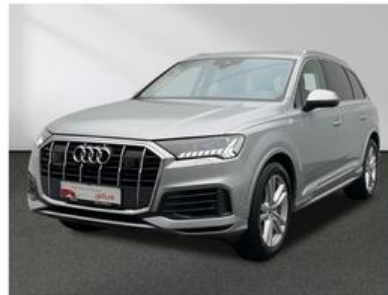
SENGER Audi Zentrum Münster Senger AZ Münster GmbH