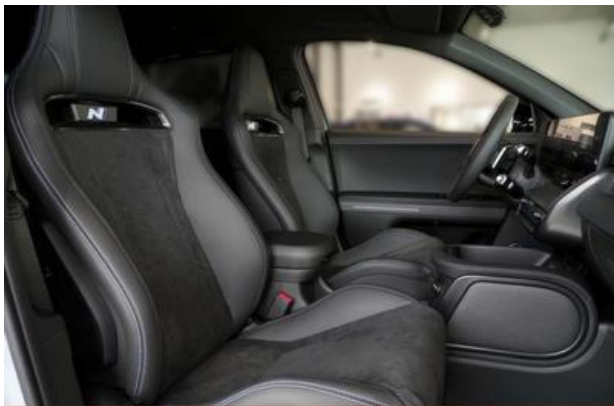
Nord-Ostsee Automobile Lust auf Leistung