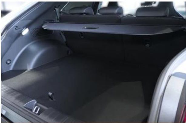
Nord-Ostsee Automobile Lust auf Leistung