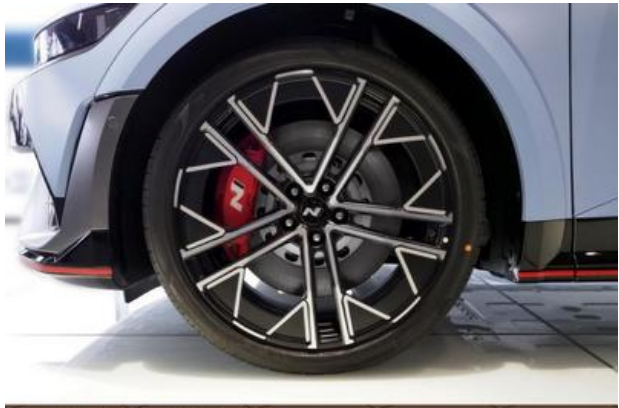
Nord-Ostsee Automobile Lust auf Leistung