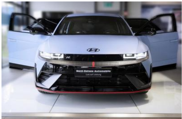
Nord-Ostsee Automobile Lust auf Leistung