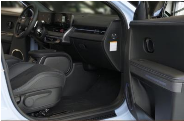
Nord-Ostsee Automobile Lust auf Leistung