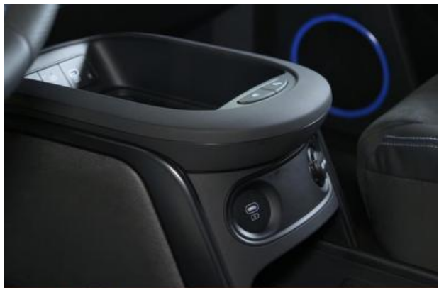
Nord-Ostsee Automobile Lust auf Leistung