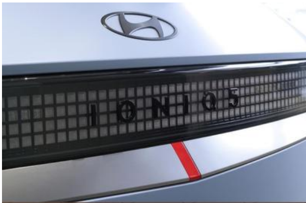
Nord-Ostsee Automobile Lust auf Leistung