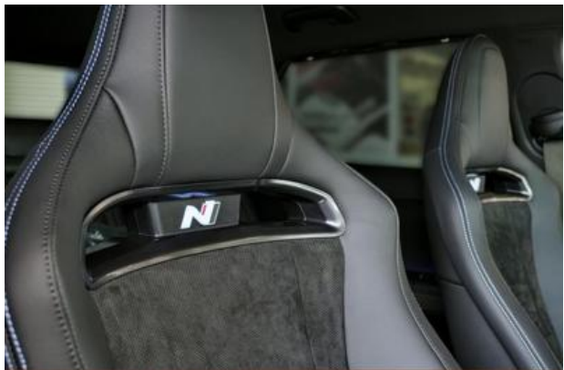
Nord-Ostsee Automobile Lust auf Leistung