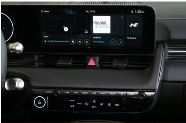
Nord-Ostsee Automobile Lust auf Leistung