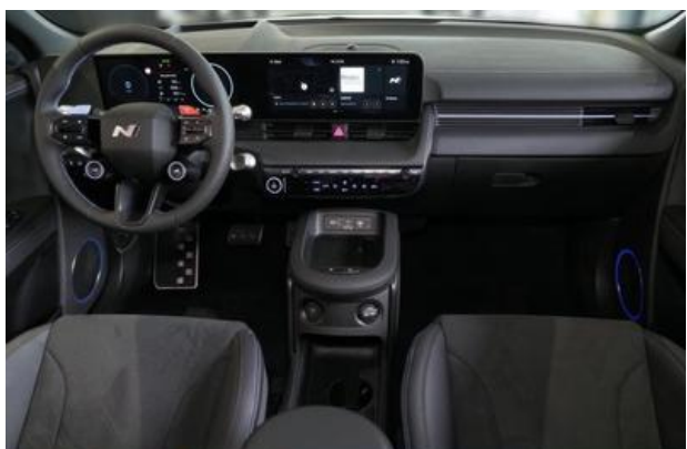
Nord-Ostsee Automobile Lust auf Leistung