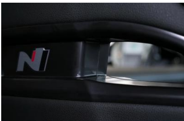
Nord-Ostsee Automobile Lust auf Leistung