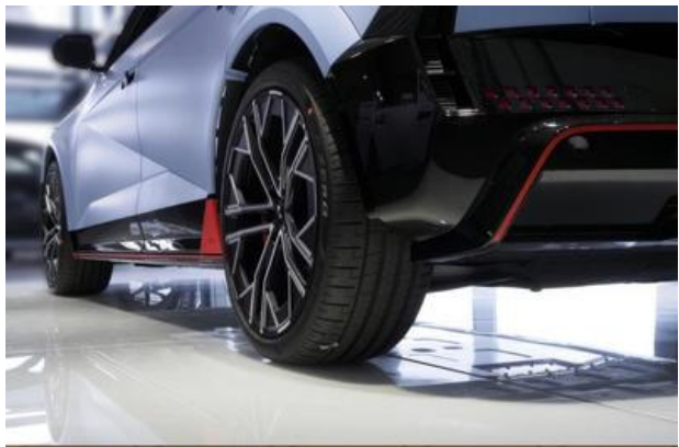
Nord-Ostsee Automobile Lust auf Leistung