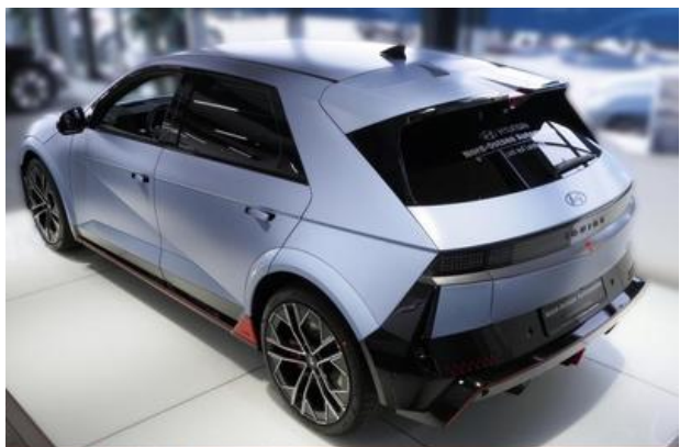
Nord-Ostsee Automobile Lust auf Leistung