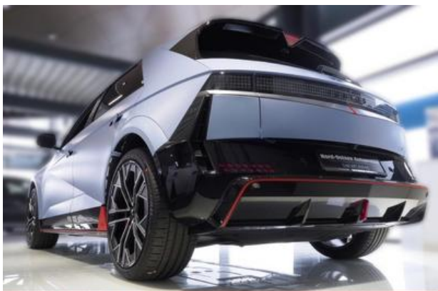
Nord-Ostsee Automobile Lust auf Leistung