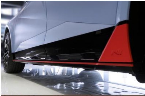
Nord-Ostsee Automobile Lust auf Leistung