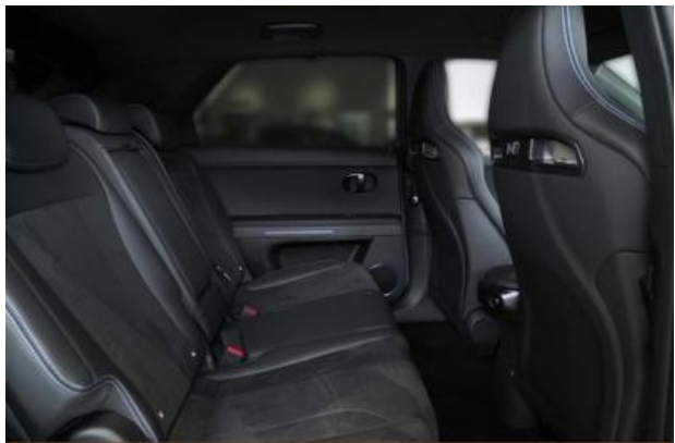
Nord-Ostsee Automobile Lust auf Leistung