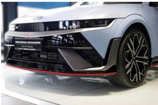
Nord-Ostsee Automobile Lust auf Leistung