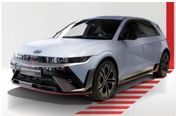
Nord-Ostsee Automobile Lust auf Leistung