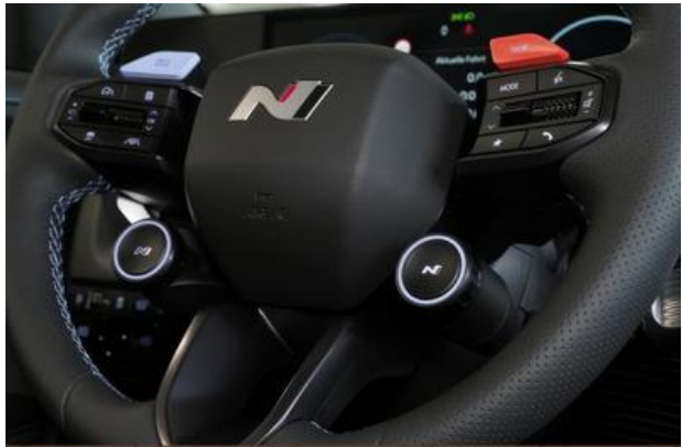
Nord-Ostsee Automobile Lust auf Leistung