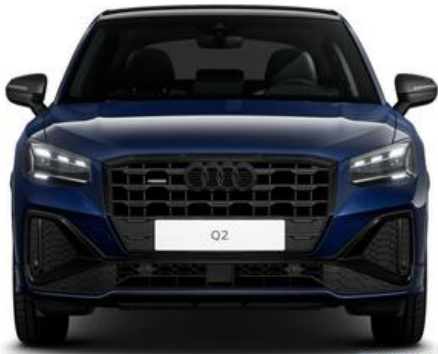
FESER x GRAF