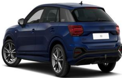
FESER x GRAF