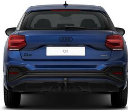
FESER x GRAF