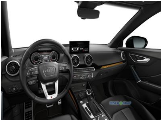
FESER x GRAF