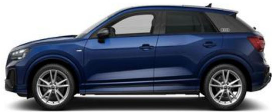
FESER x GRAF