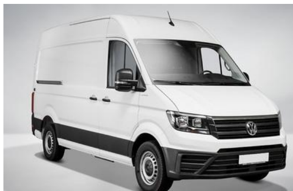
SENGER | KÜHLTRANSPORTER