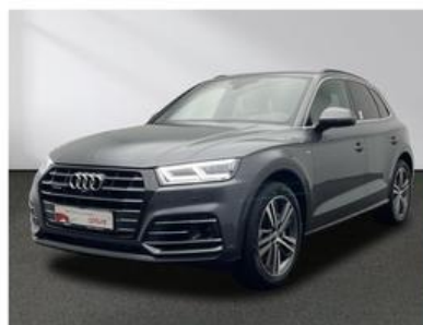
SENGER Audi Zentrum Münster Senger AZ Münster GmbH