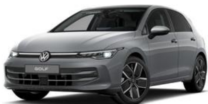
FESER ✕ GRAF