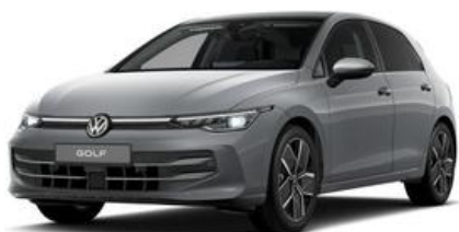
FESER ✕ GRAF