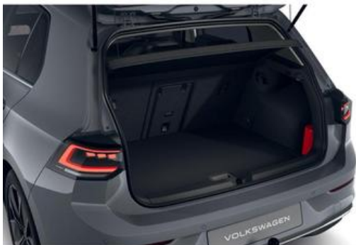
FESER ✕ GRAF