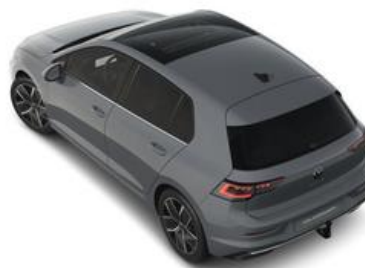
FESER ✕ GRAF