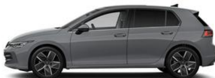
FESER ✕ GRAF