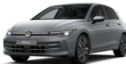
FESER ✕ GRAF