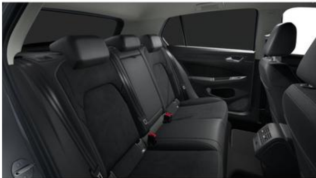
FESER ✕ GRAF