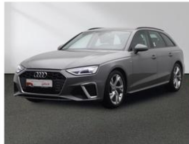
SENGER Audi Zentrum Münster Senger AZ Münster GmbH