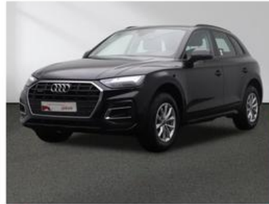
SENGER Audi Zentrum Münster Senger AZ Münster GmbH