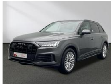
SENGER Audi Zentrum Münster Senger AZ Münster GmbH